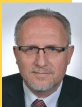
Petr HABLE starosta Nového Města nad Metují