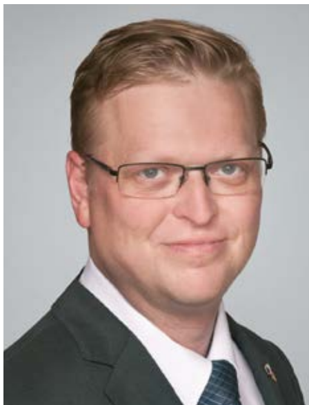
MVDr. Pavel Bělobrádek, Ph.D., MPA vicepremiér, předseda KDU-ČSL