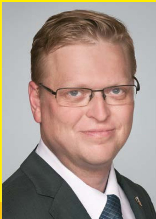
MVDr. Pavel BĚLOBRÁDEK, Ph.D., MPA vicepremiér, předseda KDU-ČSL